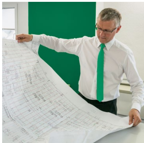
Vertriebsingenieure bei WAGNER arbeiten mit an der Entwicklung neuer, marktfähiger und modularer Brandschutzlösungen.

Vertriebsingenieure werden von WAGNER sowohl im Innen- als auch im Außendienst beschäftigt. Wir suchen Mitarbeiter, die Begeisterung für den Anlagenbau und eine technische Ausbildung mitbringen, zum Beispiel in Elektrotechnik, Mechatronik, Maschinenbau, Anlagenmechanik, Softwareentwicklung, Verfahrenstechnik, Wirtschaftsingenieurwesen oder Heizung/Klima/Lüftungstechnik. Fachlich versiertes Auftreten und eine gewissenhafte Arbeitsweise sind dabei ebenso wichtig wie der partnerschaftliche und gleichzeitig analytische Umgang mit Kunden und deren Bedürfnissen. Freuen Sie sich auf ein technisch forderndes Betätigungsfeld.